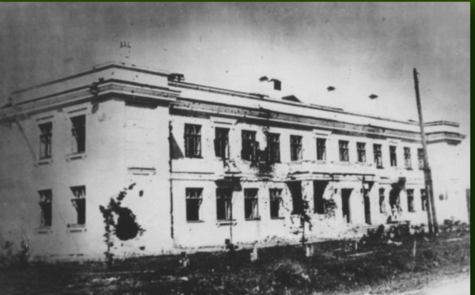
Здание детских яслей на улице Павловской. Фото 1942 года

Все тяготы блокадной жизни колпинцы перенесли наравне с ленинградцами. Немецко-фашистским войскам так и не удалось вступить на территорию Колпино. Город Колпино, единственный из городов-пригородов, занесен в золотую книгу Санкт-Петербурга за подвиг колпинцев. «За мужество, стойкость и массовый героизм, проявленный защитниками города в борьбе за свободу и независимость Отечества», Колпино присвоено звание «ГОРОД ВОИНСКОЙ СЛАВЫ».