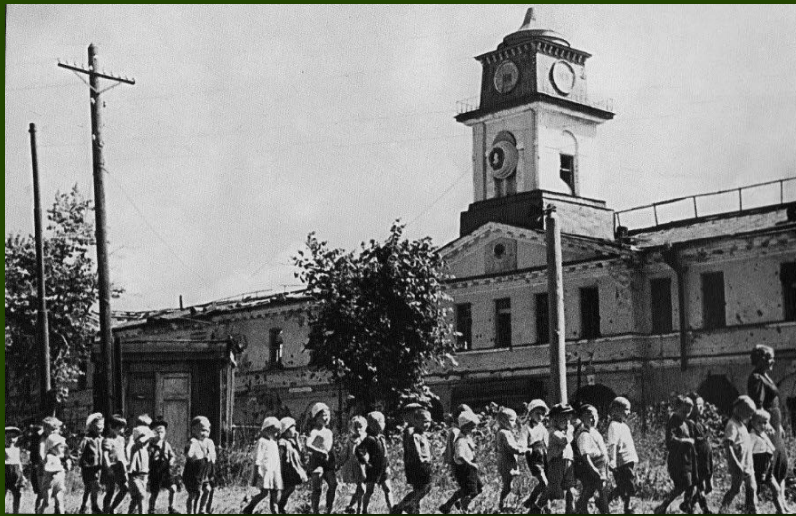
Детский сад на прогулке. Фото 1944 года