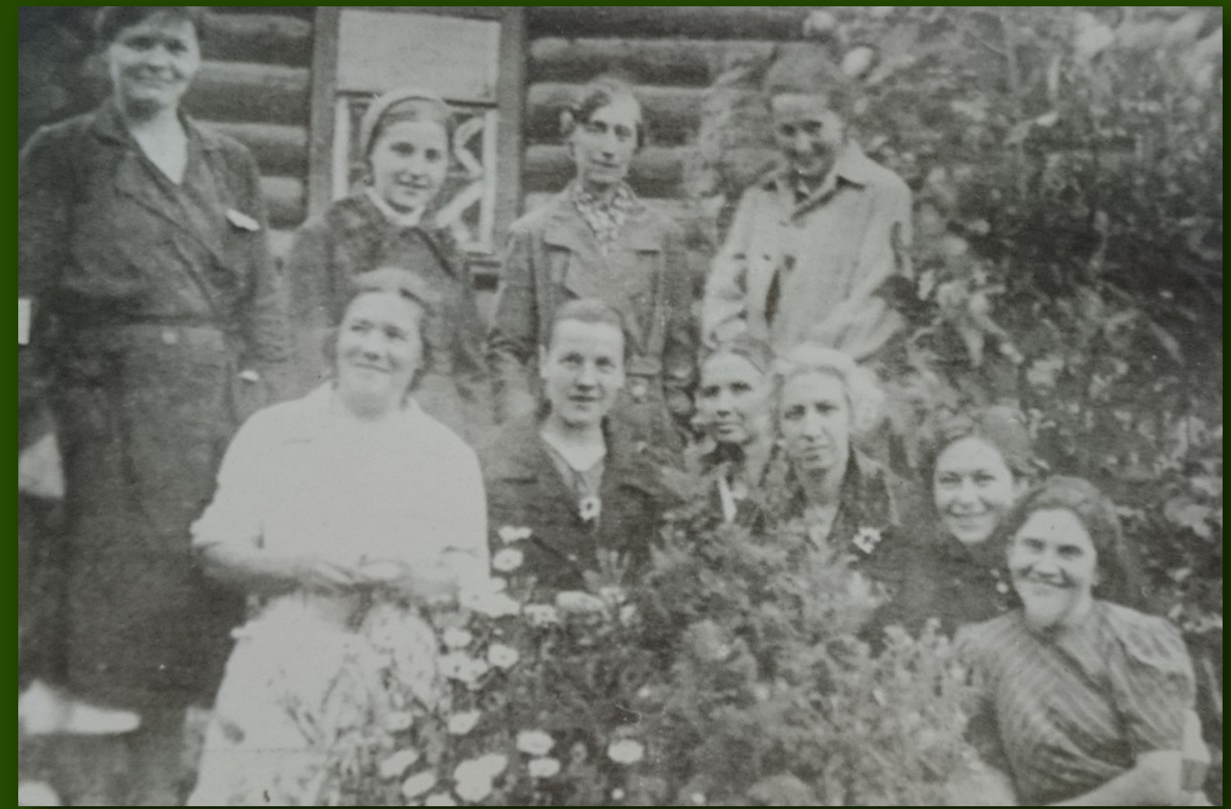
Работницы детского приёмника-распределителя