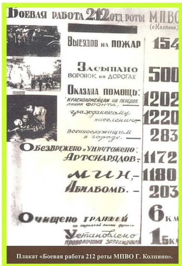
Плакат «Боевая работа 212 роты МПВО Г. Колпино».

Когда колпинское подразделение МПВО было преобразовано в отдельную 212 роту ? _____