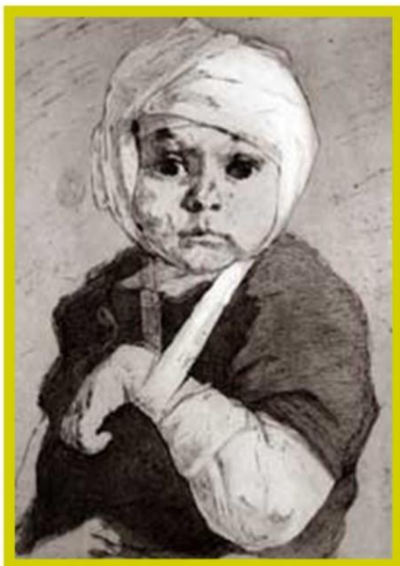
А.Хоршак "Мальчик с забинтованной головой»

Назовите имя мальчика, изображенного на картине А.Хоршака "Мальчик с забинтованной головой. Символ блокады".